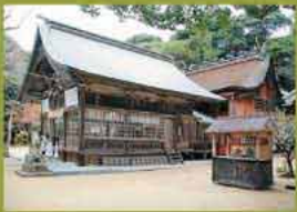
桜井神社の障子(左)と本殿(右)

毎年正月、多くの初詣で客でにぎわう桜井神社(志摩桜井)。最近は大ワースポットとしても知られています。表紙の写真は本殿の回廊にある障子。平成7年の本殿大改修時に鮮やかな彩色に飾りました。美しい表情でたずむ阿伴(あうん)の龍。表の狗(こ)犬とともに裏の守り神として、しっかりと本殿を守護しています。