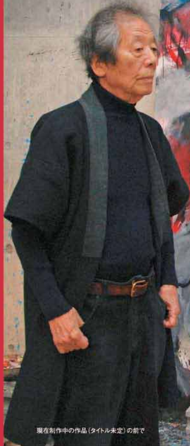
現在制作中の作品(タイトル未定)の前で