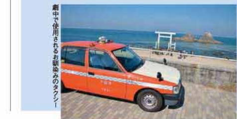
劇中で使用されるお馴染みのタクシー