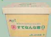
すてんなな君ゼロ すてんなな君を、さらに使いやすく改良