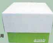
エコルン 荒廃竹林の竹パウダーを使用 した環境にやさしい商品

みなさんは、段ボールコンポストを使ったことがありますか。手軽に生ごみをたい肥にできる魔法の段ボール箱です。あなたも今日から段ボールコンポストでごみ減量を始めませんか。