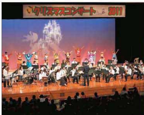
第2部のディズニー・メドレーの様子