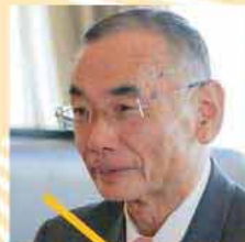
松本 嶺男 糸島市長