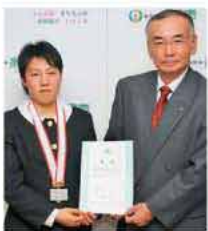
市役所を訪れ、松本市長に報告

しっかり自信を持ち、一つ一つ結果を残しながら、「体力」と勝つための技術」にさらなる磨きをかけていきます。