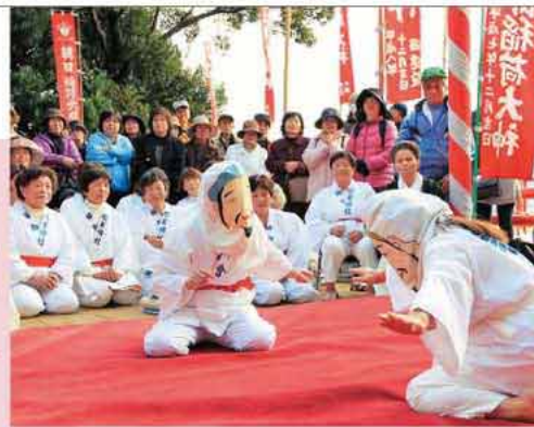
相手の位置が分からず土俵の外に出そうになる力士も

勝負が始まると男顔負けの相撲っぷりに、来場者からは拍手や笑い声が飛び交いました。