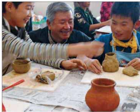
初めての土器作りに挑戦

参加した市内の小学生24人は貴重な体験をとおして、歴史を勉強することができ、充実感に満ちていました。