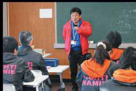
浪江町の「生活支援相談員」ミーティングの様子

浪江町は原発立地町である双葉町とはわずか2kmの距離。しかし、事前に電力会社と安全協定を結んでいなかったため、事故後の連絡は浪江町には一切入らず、支援