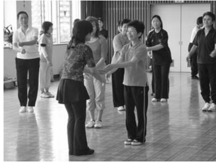
みんなでスポーツを楽しみませんか

救急車や消防車(はしこ車)などの見学も併せて行います。 開催日 9月5日(月) 時間 13時30分～15時30分 場所 糸島市消防本部(糸島市前原1783-1) 内容 ●乳幼児の事故防止の講義 ●人工呼吸、心臓マッサージなどの実習 ●消防署内、救急車、消防車などの見学(緊急出動時は中止になることがあります) 対象者 市内在住の6歳以下の子どもと保護者 募集人数 30組 申込方法 電話(申込多数の場合は抽選) 申込期限 8月19日(金) 申し込み問い合わせ 糸島市健康づくり課 ☎(332)2069