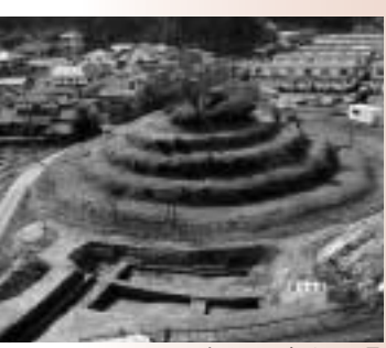
釜塚古墳の調査時の風景

JR筑肥線加布里駅から南に100m。段々に削られた古墳が、住宅街の中にあります。この古墳は「釜塚古墳」といわれ、明治18年頃に石室が発掘されており、鉄の鍬を発見したと分かりますが、詳しいことは分かっていません。その後、昭和40年代に、みかんの苗木を植えるため、古墳が削られ今の形となりました。