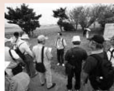
昨年開催された飛び出せ博物館の様子