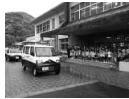
桜野校区の青ハト出発式の様子

糸島市には、ビルやマンションが林立した市街地や、住宅地域、また農業や漁業が盛んな地域など多様な地域があり、全部で162の行政区によって成り立っています。それぞれの行政区では、住