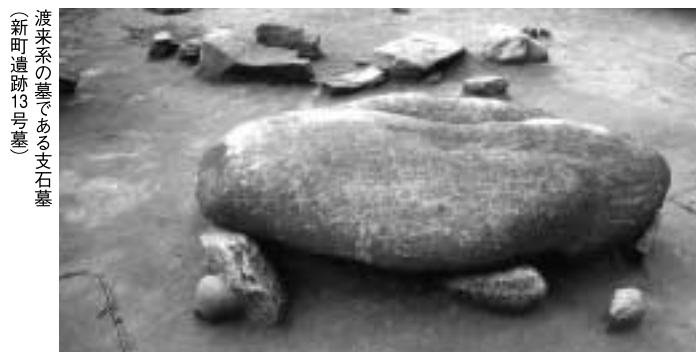
渡来系の墓である支石墓(新町遺跡13号墓)