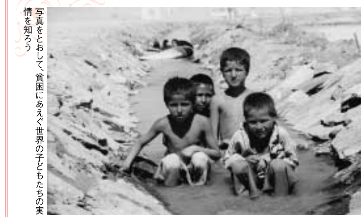
写真をおとす、貧困にあえぐ世界の子どもの実情を知ろう