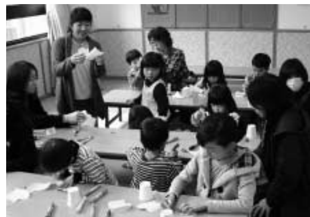
図書館のイベント「おはなし会スペシャル」の様子