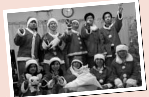
私たちと一緒に、元気に活動しませんか

糸島市青年団では、さまざまな活動を通じて多くの仲間との交流や社会貢献活動をしています。