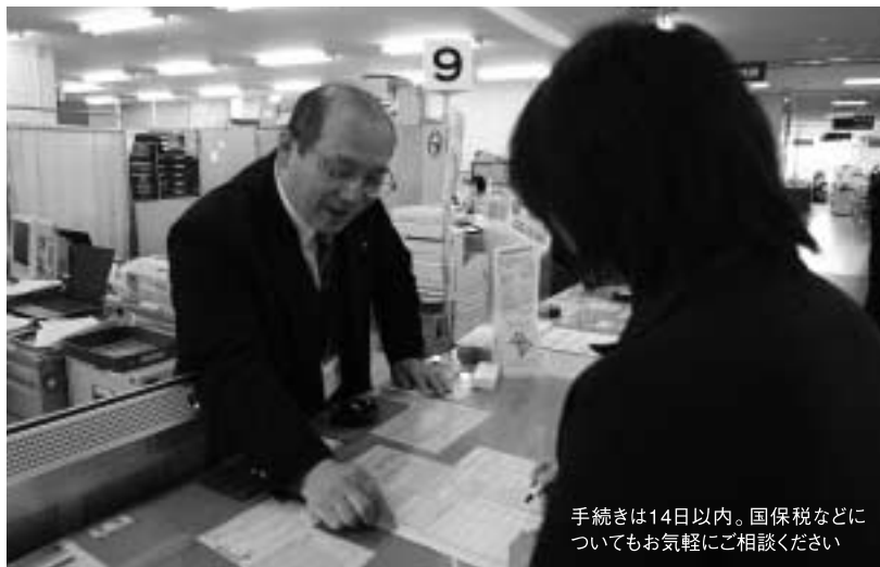
手続きは14日以内。国保税などについてもお気軽にご相談ください

詳しい手続き方法や納める保険料の金額などは、全国健康保険協会ホームページで確認ください。 URL http://www.kyokai-kenpo.or.jp/ ※協会けんぽ以外の健康保険組合などの加入者は、加入している健康保険組合などにお尋ねください。