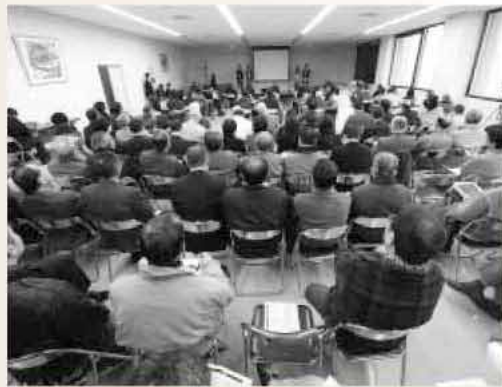
大学生の提案を聞くこうと、100人近い市民が会場に集まりました

コンテストには8チーム32人の大学生が参加し、上位4チームが発表。各チームとも、徹夜状態でプランを練り上げ、大学生らしい提案に、会場から拍手が送られていました。