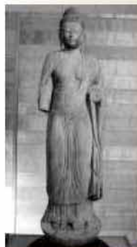
浮嶽神社如来形立像

代の初めごろまでは、神社と寺院が同じ敷地の中にあるのはごく普通のことでした。この浮嶽神社の仏像群のうちの「木造地藏菩薩立像(像高175.5cm)」「木造仏坐像(像高90.3cm)」「木造如来形立像(像高180.2cm)」の3体は、国の重要文化財にも指定されています。