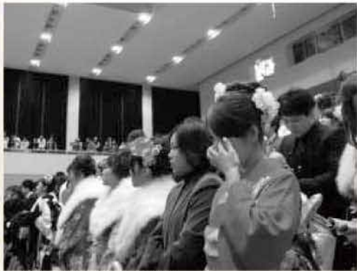
この日を迎えられた喜び。感極まって涙ぐむ人も