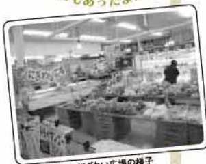
マルコーバリューにぎわい広場の様子

糸島市には19か所の農産物直売所があり、糸島の大地の恵みである農産物をみなさんに提供しています。しかし、あなたの周りのスーパーマーケットでもよく目を凝らしてください。