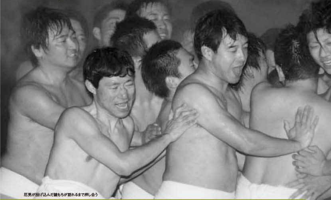
厄男が投げ込んだ餅もちが割れるまで押し合う

雪交じりの雨、男たちの体から湯気が上がる……新春恒例の「もち押し」が1月10日、桜井神社境内で行われ、見物客が見守る中、締め込み姿の若者がもちの争奪戦を繰り広げました。夜8時、厄男7人が参拝者にもちをまいた後、厄に見立てた直径30cmほどの大もちを若者の中に投げ込みます。若者たちはもちに飛びつき、もちが割れるまで奪い合っていました。