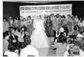
ファッションショーのイベントの様子