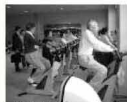
松本市熟年体育大学

●松本市 松本市熟年体育大学 熟年者を対象に生きがいづくりと日常生活における自主的な体力・健康増進および医療費削減を図っている。