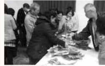
芥屋かぶで特産品をめざす