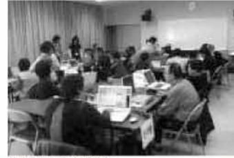
学習をとおしてみんなと交流