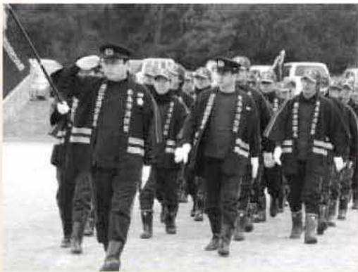
消防団の分列行進。日ごろの連携・結束が活動の大きな力