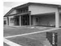
さまざまな機能が期待される公民館

答 市民の多様な学習ニーズに応えつつ、社会の変化に対応した「公民館」をめざしていきたいと考えている。