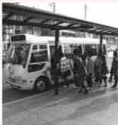
コミュニティバス (九大線)

答 効率的で便利な公共交通網を構築するために策定する。行政、事業者、市民がそれぞれの役割を果たし、協力しながら一挙一動が公共交通を維持、改善していく。