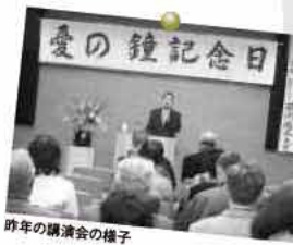
昨年の講演会の様子