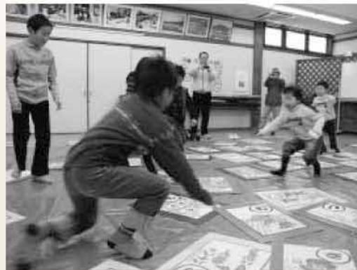
絵札を発見。勢いよく飛び込む子どもたち