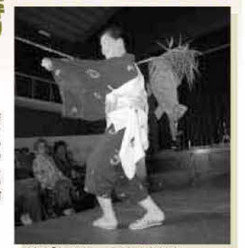
一昨年の「よか志摩フォーラム」で開催されたファッションショー

モラルになるのは、民族衣装を着た九州大学などの留学生とシニアや障がい者の市民のみなさん。 日時 3月13日(日) 14時から15時30分まで 場所 伊都文化会館 入場料 500円 ゲスト 尺八と琴・フリスターイル、西南学院大学河鹿ギターアンサンブル＆ラテンパーカッション 主催 NPO法人ジネス 問い合わせ 事務局 ☎(324)9688