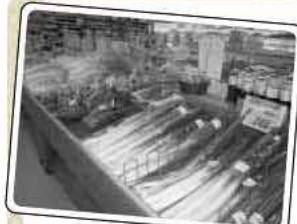
JA糸島アグリ内の売り場

● 店長から「ひとこと」 地元農家が丹精して育てた野菜で、安全・安心・新鮮をモットーに取り組んでいます。他にも地元業者が生産するしょうゆやみそ、雑穀米、花、