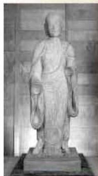
浮嶽神社地藏菩薩立像

これらの僧坊は近世には廃れてしまいましたが、古代の仏像群が「浮嶽神社」に今も伝えられています。神社に仏像とは少しちがはぐなのですが、明治時