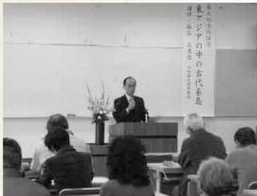
市民大学には約100人の受講生が登録