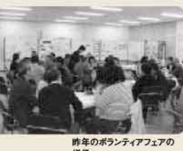
昨年のボランティアフェアの様子

● 申し込み 糸島市NPO・ボランティアセンター「こらば糸島」 FAX (0924) 01181 E-mail koraboo@city.ito-shima.lg.jp