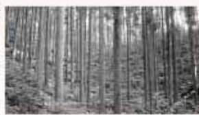
明るく、下草や低木が豊かな森林

答 平成20年度から荒廃森林再生事業に着手しており、15年以上森林施業がさされていないスギ、ヒノキ林の間伐や侵入竹の除伐などの森林整備を実施している。