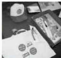
野田市まめバスグッズ

平成16年の合併を機に運行開始。運賃は100円均一であるが、市の年間負担額が1億円を超えており、路線や運行体制の見直しを随時行っている。