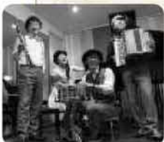
楽しいコンサートです