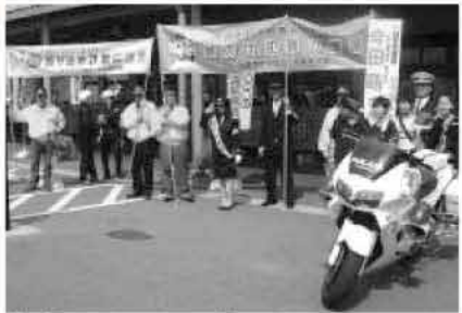
安全安心のまちづくりキャンペーンの様子

問 既存のばびるす館と新設図書館をネットワーク化し利便性を高めることをどう考えているか。 答 それぞれの図書館に所蔵する図書資料の検索、リクエストを可能に