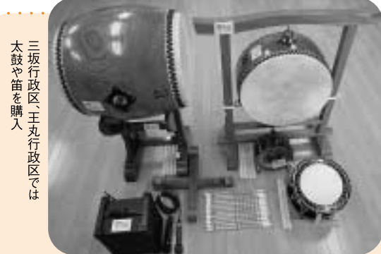
三行政区、王丸行政区では太鼓や笛を購入

地域の伝統文化は、地域が一体となって代々引き継がれていきます。継承活動は、地域の絆を深め、地域に愛着を持つことにつながります。三行政区と王丸行政区では、太鼓や笛などを購入。地域の盆踊りなどで披露されます。みなさんの地域でこの事業を活用する場合は、気軽に相談ください。