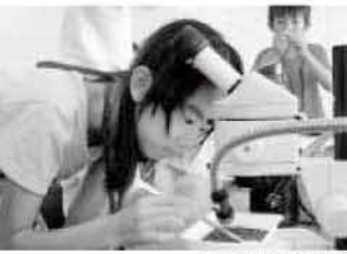
顕微鏡で貝を観察しました

平成22年度 「YA本研究会」活動中 昨年度に引き続き、今年度も市内の高校、中学からYA委員が選出され、すでに3回の会議を開催しました。 今年度は、YA委員の半数は男子生徒。ライト・ノベルや絵本・ファンタジーなど、いろいろなジャンルを選んで、互いに薦め合い、読み合いながら、楽しく会を進めている最中です。 来年3月には、このメンバーが選んだ「YA本お薦めリスト」が完成予定です。 ※YAとは、ヤング・アダルト（ティーンエイジャー）