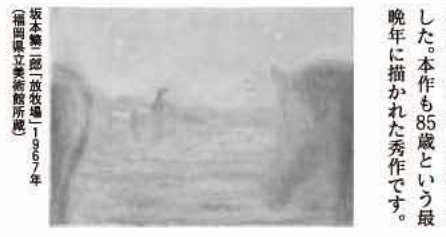
坂本繁二郎「放牧」1957年(福岡県立美術館所蔵)

坂本繁二郎(1882~1969)は久留米市出身。久留米高等小学校で図画教員だった森三美に洋画の基礎を学びました。幼なじみの青木繁が東京から帰省した折、触発されて上京。画塾不同舎、続いて太平洋画会研究所で学びました。 1910・11年と文展で連続受賞。1921年に渡仏。1924年に帰国後は久留米市に居住し、のちに八女郡へ転居。戦後は無所