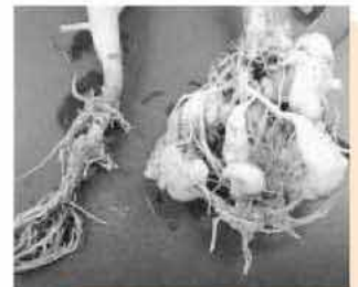
正常な株(左)と根こぶ病の株(右)