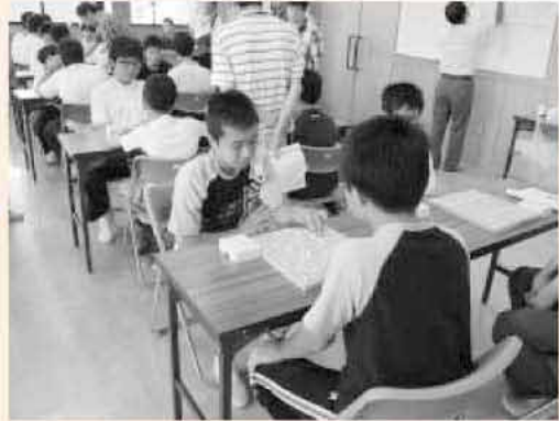
先を読みながら、慎重に一手を打つ子どもたち