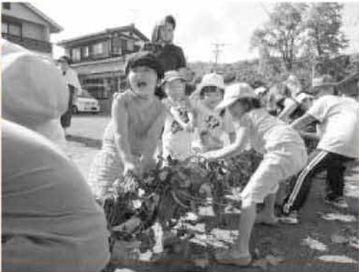
青々とした蔓の綱を、大人と子どもで引き合いました

15時ごろ、この綱で3本勝負の綱引きが開始。3本目の勝負で綱は真ん中から切られます。綱引きが終わると、切られた綱で砂浜に土俵が作られ子どもも相撲が行われました。