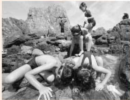
「何か、ある」「あっ、魚」「捕まえよう」……磯遊びに夢中です

こぶ島は、海に浮かぶ岩礁。糸島半島を海から望み、ひとときわ美しい水の中には、いろんな生き物が動くのが見えます。 子どもたちは島に着くなり、海に入り、磯遊びに夢中です。泳いだり、潮だまりの魚を捕まえようとする子どもなど、楽しさいっぱいのアドベンチャーとなりました。