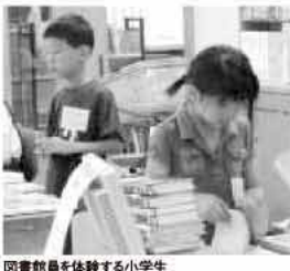
図書館員を体験する小学生