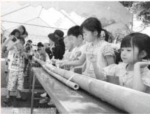
自分たちで作った箸や器で食べるそうめんは格別の味

中には「自分で作った箸は食べにくい」と言い、周りの笑いを誘う子どももあり、会場は暑さも吹き飛ばす笑顔で包まれました。