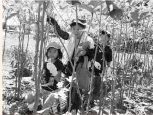
育文より高いオクラのジャングルで収穫体験（志摩吉田）

この日は、志摩吉田での豆野菜の収穫体験や二丈福ふくの里での「糸島カレー」作り、怡土公民館での旬菜クッキングなどを実施。 ファームパークでは、ペットボトルのいかだ作りやウナギのつかみ捕りなどのイベントも開催され、楽しい「食」体験となりました。