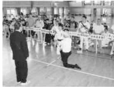
糸島市体育大会の開会式の様子