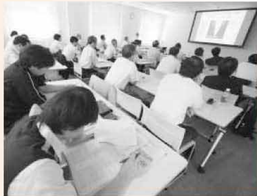
動画を使った、水素車両の火災実験なども紹介されました

この日は、音波で水素濃度を測るセンサーや、閉ざされた空間での水素の拡散、燃料電池自動車の安全性確保のための実験など、水素をめぐる最新研究が紹介されました。 将来、最も有効なエネルギーとして認知されている水素。それだけに参加者たちは真剣に聞き、盛んに質問が飛び出していました。