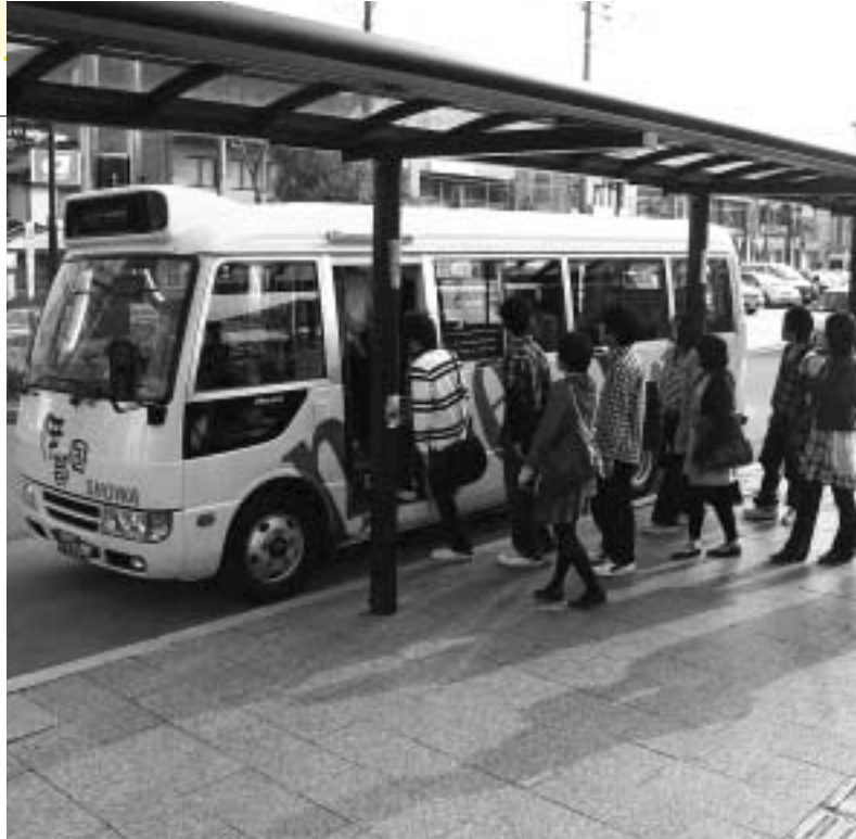
コミュニティバス利用者の増加が、市民の交通手段として発展のカギとなる (写真は九大線の筑前前原駅前)

みんなで利用しよう コミュニティバスの利用者は、昨年よりも増えましたが、路線別では九大線と庁舎線を除く全路線で10%ほど減少しています。 市では、バスの運行に補助金を出していますが、年々、利用者が減少傾向にあるため、このままでは、減便や路線の縮小・廃止の事態も考えられます。 バスは、移動手段を持たない人にとって、無くてはならないたいせつな交通手段です。ぜひ、市民のみなさんのバス利用をお願いします。 コミュニティバス各路線の紹介 白糸線 ▼白糸・美咲が丘・前原駅前口・伊都文化会館 雷山線 ▼雷山観音前・有田・前原駅前口 曾根線(有田経由) ▼曾根グラウンド・有田・前原駅前口 曾根線(波多江経由) ▼曾根グラウンド・伊都菜彩・浦志・前原駅前口 井原山線(202号経由) ▼井原山入口・伊都菜彩・浦志・前原駅前口 井原山線(篠原経由) ▼井原山入口・伊都菜彩・あごら・前原駅前口 川原線 ▼雷山の森・周船寺駅・浦志・前原駅前口 前原今宿線 ▼今宿駅・高田・浦志・前原駅前口 九大線(波多江経由) ▼九大工学部前・波多江駅・浦志・前原駅前口 九大線(泊経由) ▼九大工学部前・泊一区・医師会病院前・前原駅前口 九大線(油比経由) ▼九大工学部前・馬場・油比・医師会病院前・前原駅前口 ※庁舎線については、下図のとおりです。