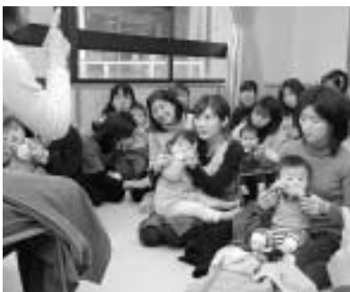
昨年のおはなし会の様子

季節ごとに開催している赤ちゃんおはなし会。わらべうたや赤ちゃん絵本、手あそびや指あそびなど、毎回楽しい内容で大好評です。今回はそのスペシャル版です。赤ちゃん