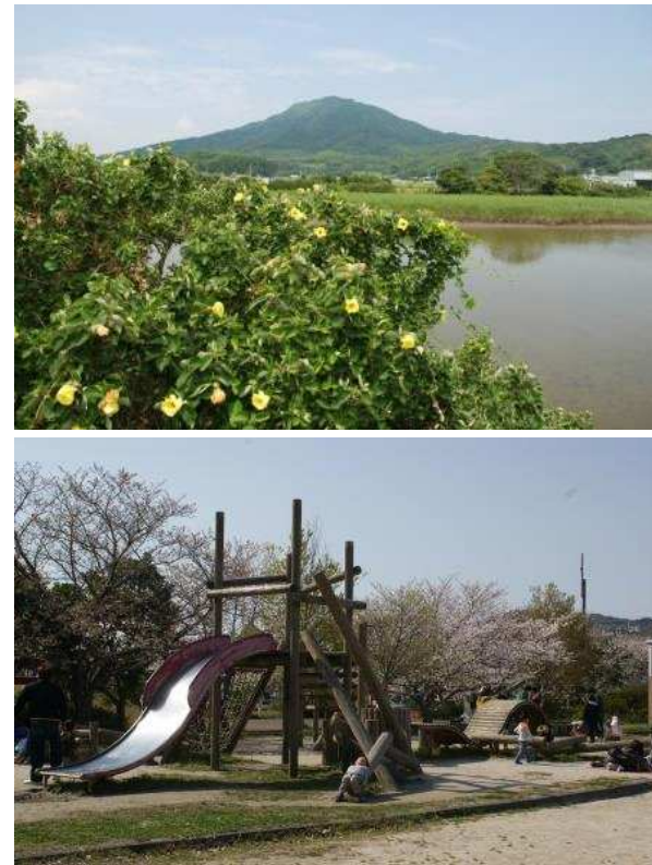
上 / ハマボウと可也山 下 / 志摩中央公園

各行政区には、その区をとりまとめる区長さんがいます。また、生活に密着した地域の情報提供や、日々の生活に関する不安や疑問の解消を目的に、地域コーディネーターさんも配置しています。区長さんや地域コーディネーターさんに聞いてみたいことや、案内してほしい場所があれば、お気軽に糸島市地域振興課(092-332-2062)までお問い合わせください。