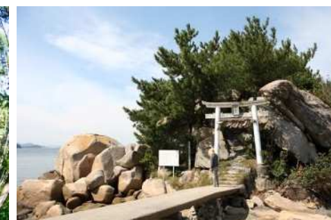
左/フォレストアドベンチャー 右/箱島神社