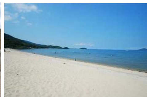
左 / きららの湯 右 / 深江海岸