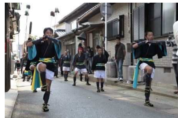
上 / 目かくし女相撲 下 / 深江神幸祭