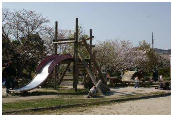
上 / ハマボウと可也山 下 / 志摩中央公園