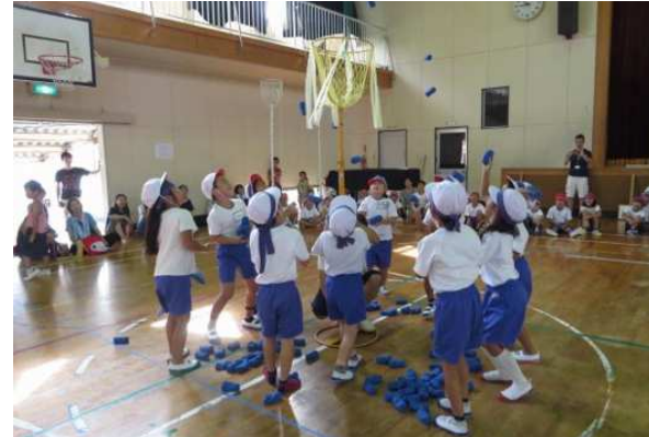
上 / 瑞梅寺川流域の桜 下 / 校区子ども球技大会の様子

結婚を機に糸島へ。私は運転免許を持っていないし、夫の通勤にも便利なおと、JR沿線で住まいを探し、最終的に波多江校区に落ち着きました。病院やお店が近いのはいいですね。子どもが病気のときに、車が使えなくても病院に行けるといえるのは安心です。校区の行事自体は少ないのですが、体育祭の競技にはいつも参加しています。また、各行政区で開かれる夏祭りは子どもたちも楽しんでいきます。田んぼの用水路にはいろいろな水中生物があり、自然が身近に残っていると感じます。田んぼが水田になると、夏でも夜は風がヒンヤリして涼しいです。