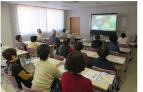
コミュニティセンター講座の様子

地域住民に参加していただく生涯学習の拠点として、教養向上と健康増進を図る施設で、コミュニティセンター講座やサークル活動を推進しています（令和元年度は45サークルが活動）。校区コミュニティ推進協議会や校区諸団体の事務局が置かれ、校区事業等様々な活動が活発に行われています。毎年12月には「生の音楽」を身近に感じてもらうことを目的とした音楽祭も行われています。