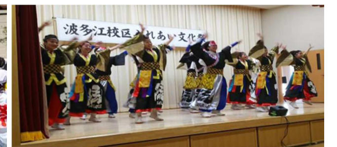
左 / 各行政区で行われる夏祭り（神輿） 右 / ふれあい文化祭の様子