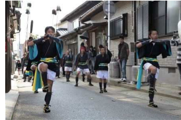
上 / 目かくし女相撲 下 / 深江神幸祭