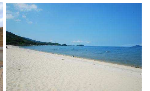
左/ きららの湯 右/ 深江海岸