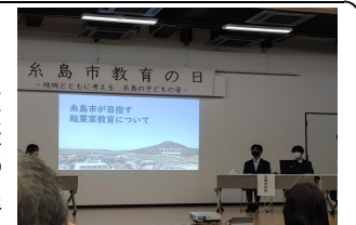
教育の日実践発表

本校で、昨年度から、総合的な学習の時間に学習している、「起業家教育」について、11月4日(土)の糸島市「教育の日」で「模擬会社GALAKSIO」についての実践発表を行いました。課題を把握し、みんなで会社を経営している内容を、多くの方々に知ってもらえる機会となりました。その後、活動の様子をKBC放送「アサデス」の取材で、活動の様子を2回放送していただき、福岡県内に生徒たちのがんばりを発信することができました。