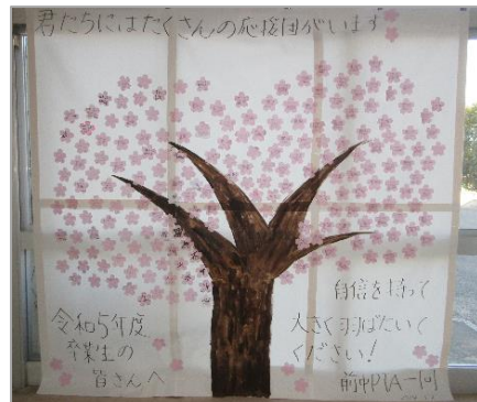
【PTAからのメッセージ】