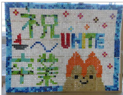
【ペットボトルキャップを使用した作品】

PTAからは、役員さんが生徒には内緒で、メールで保護者に依頼をして、卒業する生徒へのメッセージを桜の花びらに記入してもらい回収しました。また、前中校区の4つの小学校へも依頼をして、先生方からメッセージをいただきました。役員さんと保護者の有志で、桜の花びらを切り抜き、模造紙6枚分に散りばめました。一つ一つの花びらには、子どもを想う保護者の心情と新しい世界へ旅立つ子どもに対する激励のメッセージが綴られています。