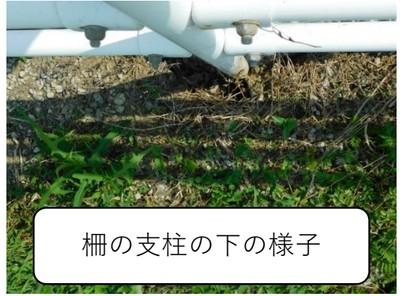
柵の支柱の下の様子

間少路の道路の歩道に設置されている柵の支柱の下の部分の土が流失して倒壊の危険があります。