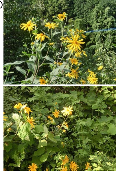
【梅林に咲いていた花】

8月下旬になっても気温がなかなか下がらず、高温が続いていて、熱中症を大変心配しています。「暑さ指数(WBGT)」を確認しながら、安全に教育活動を進めていきたいと思えます。