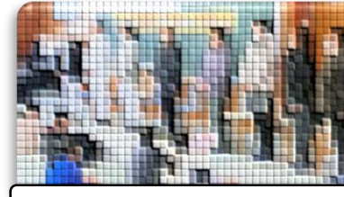
調理員さん、桜野グリーンのみなさん等給食に係わる方々