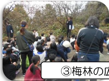
③梅林の広場での様子