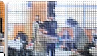
感謝の手紙を代表者が渡しています。