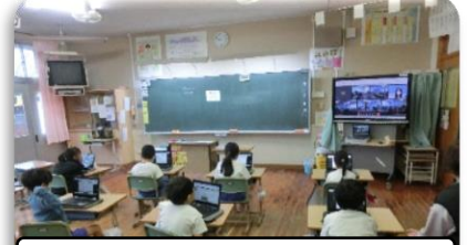
モニターで総務委員会の提案を視聴している様子

2月17日（土）の6年生を送る会に向けて、総務委員会から6年生を送る会の原案の提案が、1年から5年生にあり、この原案をもとに修正案を話し合ったり、各学級での取組を始めたりしています。6年生に感謝の気持ちがあふれる楽しい会になるのではないかと今から期待しています。