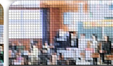
野菜づくりに関する子どもたちからの質問