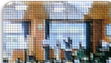
保健・給食委員会による給食に関するクイズ