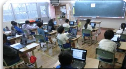
提案の文書をタブレットで見ている様子