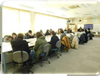
入学説明会での講話の様子