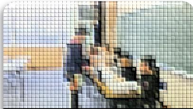
総務委員会が提案してる様子