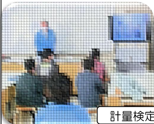
計量検定所の方のお話