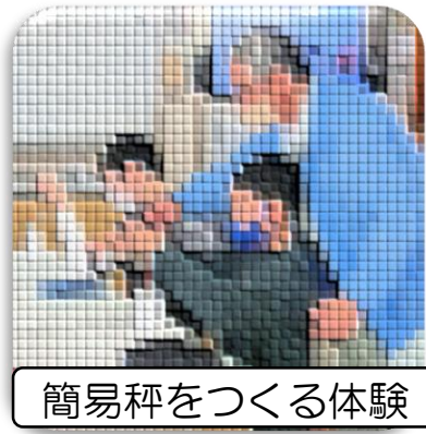
簡易秤をつくる体験

タクシーの料金メーター、ガソリンスタンドのメーター、お店の食料品の重量等正しく表示されているか、管理する機関である計量検定所の方に授業をしていただきました。普段あまり意識していない計量は、私たちが生活するためにとっても大切であるとの認識を高めることができました。