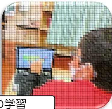
中学校生活の説明

英語の授業では、アルファベットについて学習しました。中学校生活の説明では、1日の流れや部活などの説明を受けました。このような取組を通して中学校生活への不安を少しでも小さくし、期待を膨らませてもらいたいと思っています。