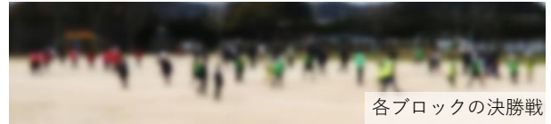
各ブロックの決勝戦