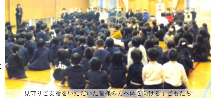
見守りご支援をいただいた皆様の方へ体を向ける子どもたち