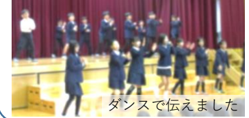
ダンスで伝えました