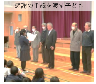
感謝の手紙を渡す子ども

当日、お越しいただけなかった方、保護者の皆様へもこの学校だよりを通じて感謝の気持ちをお伝えします。ありがとうございます。多くの方に見守られ、子どもたちは安全・安心な学校生活を送ることができています。今後も引き続き見守りやご支援をお願いします。