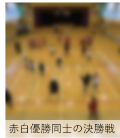
赤白優勝同士の決勝戦