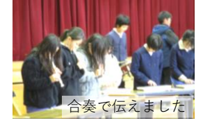
合奏で伝えました