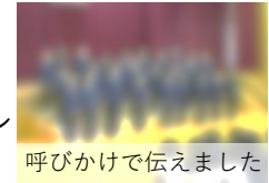
呼びかけで伝えました

2年生テーマ「縦割り活動」 ➢1～6年生が混在するグループで協力して一貴山小フェスティバルや遊びの会をする活動