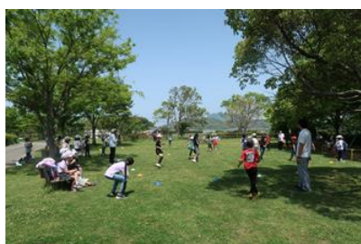
【曲田公園での様子】