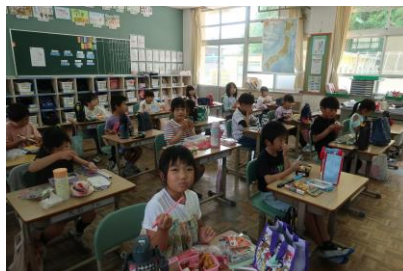
【教室へ戻って、おべんとうを広げて、おいしくいただきました】