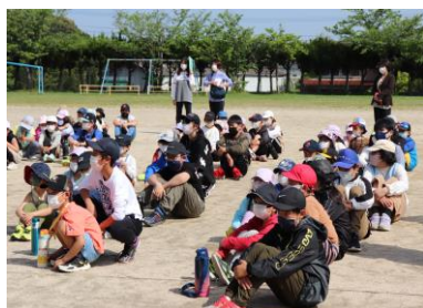
【全校でのお迎え集会】

その後、すぐ隣の「歴史の里曲り田スポーツ公園」に向けて1, 6年生が発しました。この日は、日差しも丁度よく、さわやかな風が吹く中、全員が到着すると、注意をした後解散となりました。6年生は、1年生を見守りながら公園の中を散策したり、遊具で遊んだり、時間いっぱい遊ぶことができました。その後は、2, 5年生、最後に3, 4年生と50分間ずつの交代となりました。中学年は、学級みんなでドッジビーを楽しむ姿が見られました。学校へ帰った後は、教室でおいしいお弁当を食べました。保護者の皆さまには、朝早くから弁当づくりや遠足の準備等でお手数をおかけしました。どうもありがとうございました。