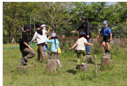
【曲田公園での様子】