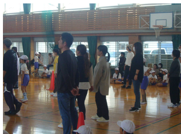
3年「親子ドッジボール」

11月中に、2年生から6年生まで（1年生は延期）「親子ふれあい学習」が行われました。それぞれ学年の役員さんを中心に内容が工夫され、子ども達も楽しそうに活動していました。コロナ禍で保護者の方の来校が制限されていた間は、このような親子での活動も見られませんでした。やっと再開できた感じです。特に2・3年生は初めての活動になりますし、6年生は小学校生活最後の活動になりました。それぞれの子ども達や保護者の皆様にとって、ステキな思い出になっていたら幸いです。