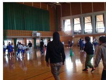
6年「親子ドッジビー」