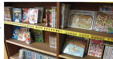
【↑購入した図書の一部】

これに加え、今年度は、雷山校区の社会福祉協議会から児童用図書費用30万円分の寄付をいただき、「子どもたちに人気のある本」、「授業で調べ学習に使える本」、「子どもたちの心の成長のために是非読んでほしい本」等を選定・購入し、図書室に配置しました。