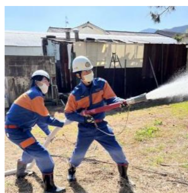
【深江分団による放水訓練】

3月5日(日)糸島市消防団 深江分団は深江観光ホテルで大規模施設火災を想定し、延べ300m