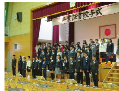
【深江小学校卒業生】