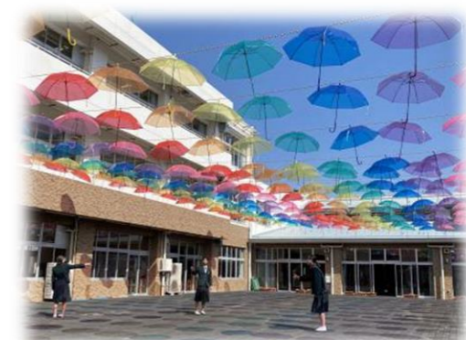
【二丈中中庭に飾られたアンブレラスカイ】

PTA 運営委員会を中心に「二丈中のみんなが笑顔になって欲しい」という思いからアンブレラスカイを企画されました。《アンブレラスカイとは》