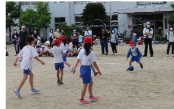
【令和4年度 球技大会】