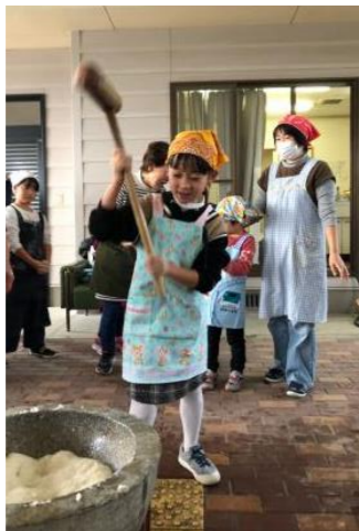
【第1回餅つき大会の様子】

コロナ前に行政区の親睦を図るため第1回「餅つき大会」を営農センターで開催しました。しかしながら、2回目を開催することができず、コロナ対策が緩和された今期は、是非開催したいと思っています。