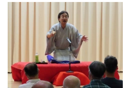
【令和4年度 人権講演会】