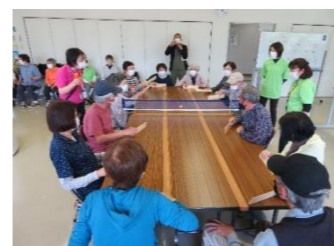
【令和4年度 卓球バレー】