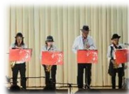
糸島 SAX グランマ&パパ