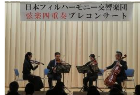
【弦楽四重奏プレコンサート】

皆さんからのアンケートには、「プロの演奏を身近で聴け、癒された。」「楽しい時間をありがとう。」「と多くの方が「良かった。」と想いを書いていただきました。