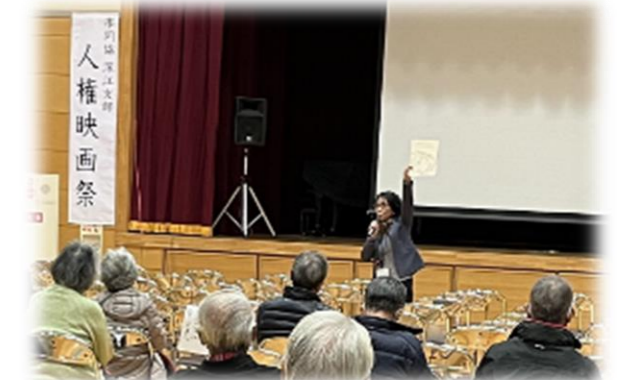
【深江小学校長あいさつ】

今回、深江小学校体育館で開催された人権映画「僕がジョンと呼ばれるまで」には行政区やPTA、小学校5・6年の児童、先生方等、170名程の参加の中、上映されました。