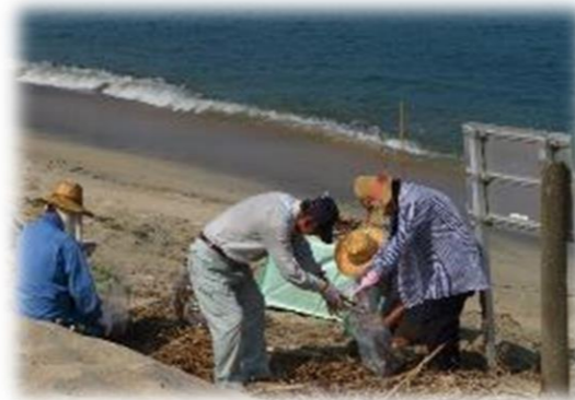
【前回の海岸清掃の様子】