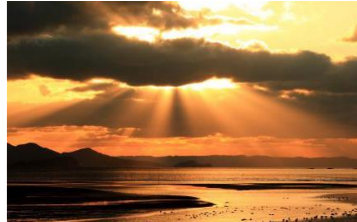
「竜雲参上」