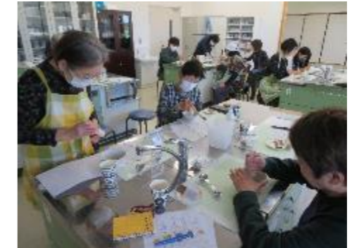
【山椒をすのこ木でつぶします】