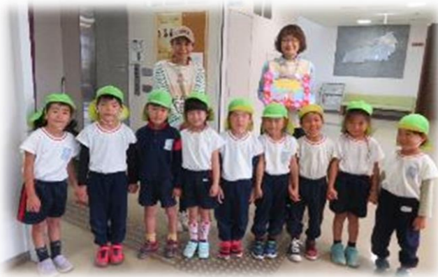
【はこべ幼稚園の園児と先生】

作品は、こもれび館事務所入り口に飾っていますので、来館の際は、ご覧になってください。