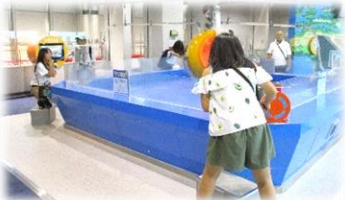
力を合わせてタンクに水を溜める装置

参加者がこの日学んだことや感想をまとめたハガキを、文化祭で展示しますので、ぜひ見に来てくださいね！