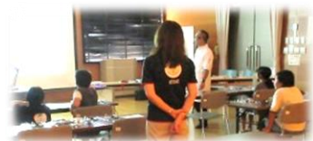
先生の話に夢中の子もたち

「百聞は一見に如かず」この体験が、子どもたちの今後のくらしや、電気への考え方に役立つことを願っています。