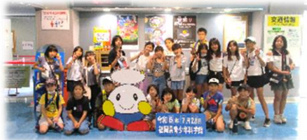
参加者全員で記念撮影