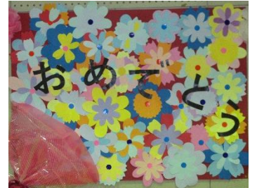
在校生からのおめでとうメッセージ

2月18日(土)、加布里小学校体育館で「6年生を送る会」が開催されました。今年度は6年生だけが体育館に入り、1年生から5年生までがステージで学年ごとに発表を行いました。劇やクイズなど、それぞれ工夫を凝らした発表で、お世話になった6年生への感謝の気持ちを直接伝えることができました。会の最後に先生方から贈られた思いの詰まった言葉たちを胸に、6年生は3月17日小学校を巣立っていきます。