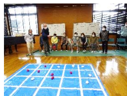
五目お手玉 よ〜く狙って