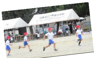
1年生の徒競走 この後、雨が...