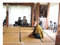
宝林寺で坐禅体験