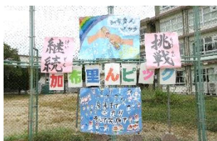
6年生が作成した看板

10月16日加布里小学校運動会「加布里んピック」が開催されました。途中から雨が降り出し、特に5・6年生は本降りの雨に降られながらの表現・競技となりました。しかし、さすが高学年。濡れたグラウンドに伏せたり、徒競走では時に転倒したりしながらも、最後までやり通す姿を見せてくれました。