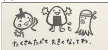
ハンコを使ったカード(例)