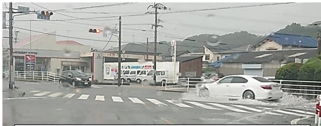
8月14日 冠水した加布里交差点の様子

先月12日から17日にかけて、歌舞里館に避難所が開設されました。雨が長時間降り続いたため、長野川が増水し、一部の道路が冠水するなど、ヒヤリとする場面もありました。