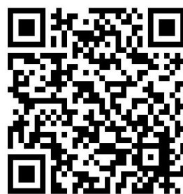
みなみの風 QRコード